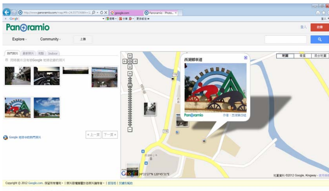
圖 2 Google Panoramio 收錄學生上傳的數位相片