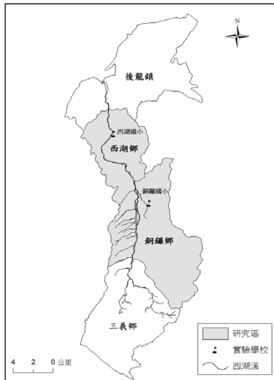
圖 1 研究區與參與學校位置圖

活動正式開始前由研究者(即作者)拜訪兩所學校校長和教務主任討論計畫內容和實施方式，小組輔導員由臺灣師大地理系大學部與碩士班共六位學生擔任，在活動進行前先進行輔導員培訓，讓合作夥伴對活動的進行能保持一致性，培訓內容包含：1. 瞭解計畫宗旨、內容與進行方式；2. 學習如何在分組活動時引導小學生思考、發言和填寫學習單；3. 協助各小組上傳相片與景點解說到網路相簿，並在電子地圖中標定相片的拍攝地點。教學活動的進行前後約一個月的時間，活動流程有以下五個步驟：