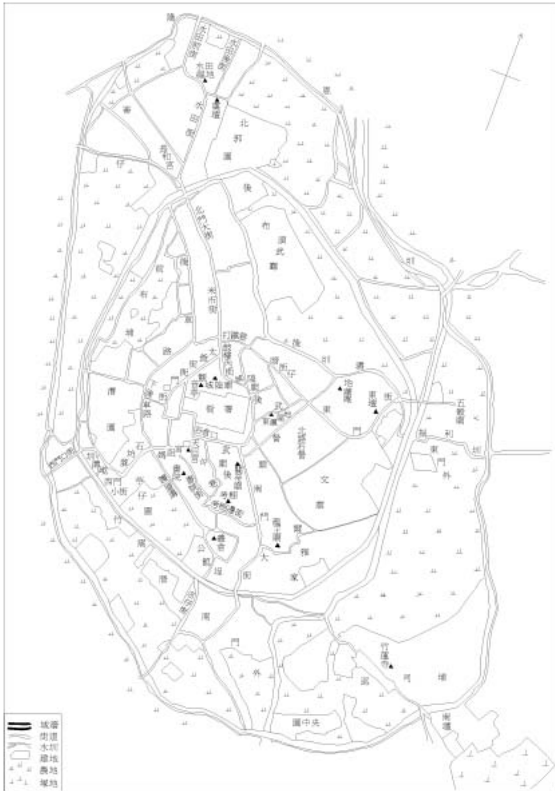
圖 2、竹塹城內土地利用圖