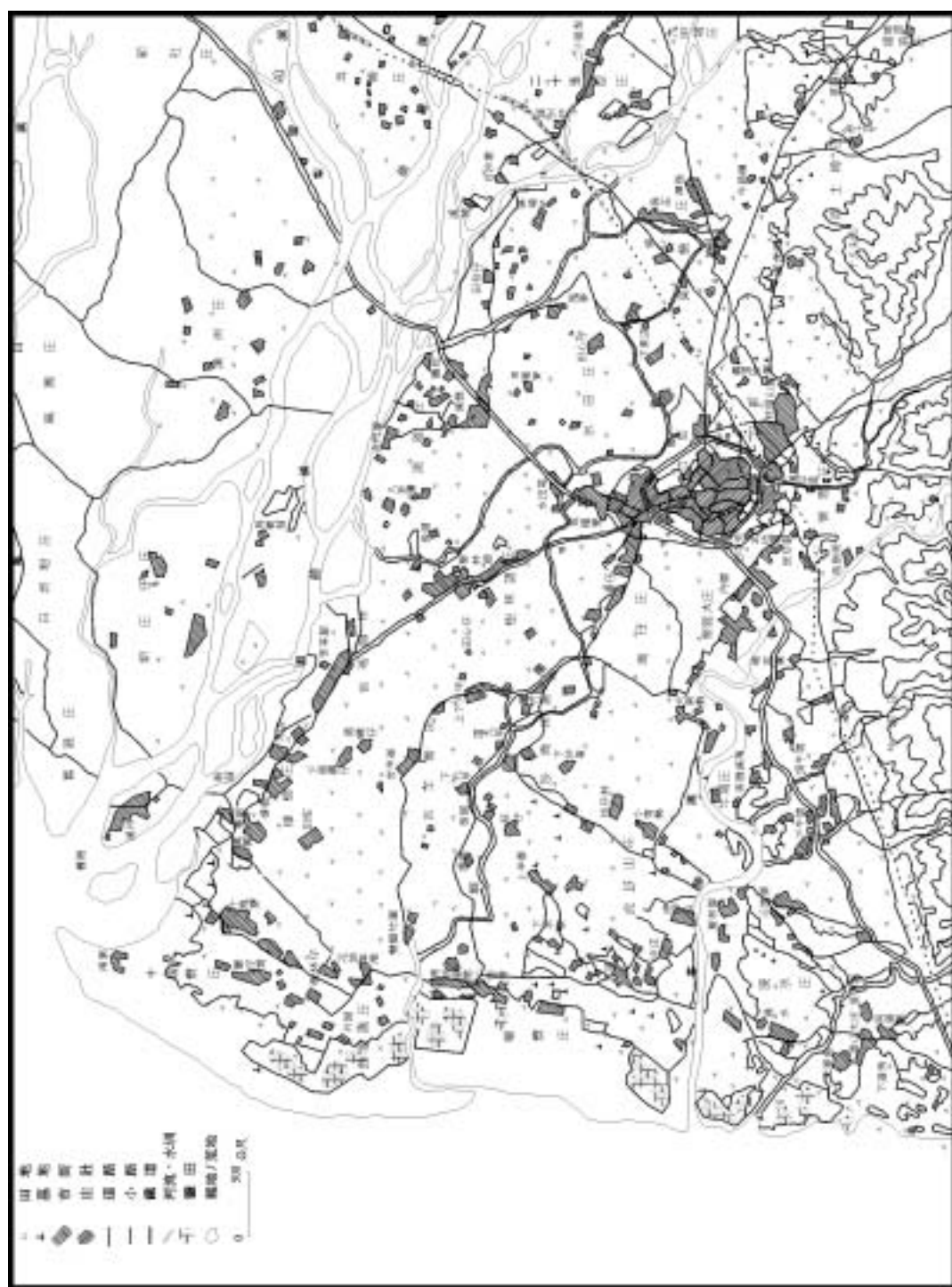
圖1、新竹平原區的發展(1904年)