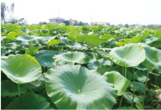
照片11 茨城縣的蓮藕產量全日第一