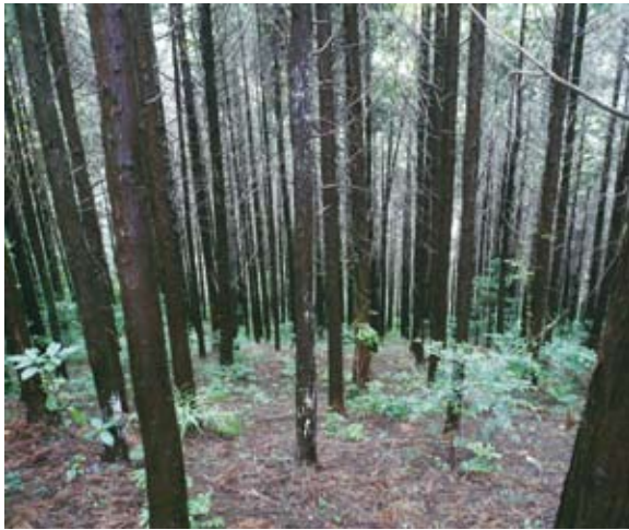
照片1 未經疏伐的人工林地被植生少