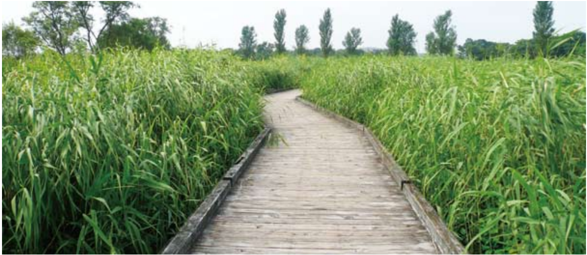
照片16 霞浦湖濱濕地步道

製作、森林生物調查、木工教室等。申請團體於6月30日前將申請書寄達附近的農林事務所，經審查通過後即可辦理活動。