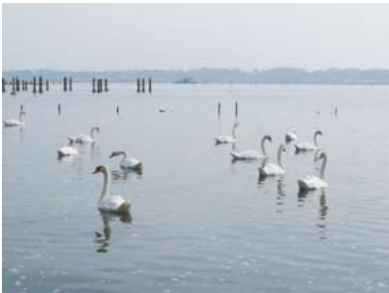
照片12 霞浦湖是全日第二大湖

教育提升縣民意識部分，印製宣傳手冊2萬份，有5,400人參加森林感恩祭。另外，補助舉辦森林體驗活動的團體，共計30件，有6,859人參與，並補助12校針對學童進行森林整備教育，參加者有1,634名學童，並有443人參加體驗學習(茨城縣林政課，2010)。