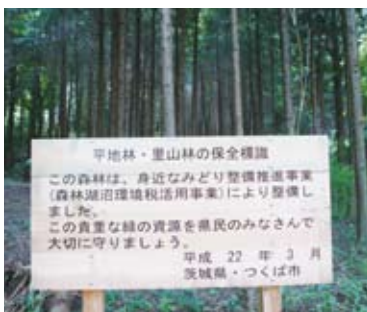
照片7 經整備後的平地林及社區林