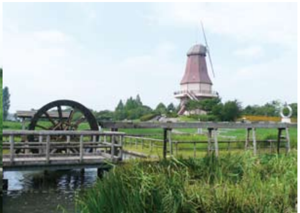
照片15 霞浦總合公園