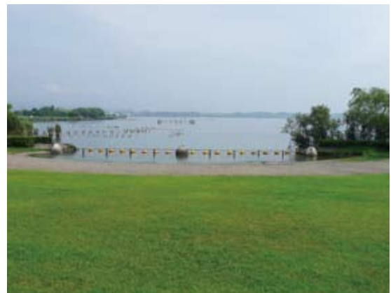
照片13 霞浦湖畔戲水區

2008年，湖沼河川的水質保全重要工作成效如下：(1)生活廢水污染負荷量削減部分，補助高度處理型淨化槽1,026件、單獨處理型淨化槽295件，估計一年可減少COD24公噸、全氮量4公噸、全磷量0.4公噸；補助城市下水道接管工作676件、農村排水設施137件，估計一年可減少COD15公噸、全氮量6公噸、全磷量0.6公噸；補助畜牧業污水處理8件，並配置10人至工廠檢查污水；(2)農地及市街道流出水處理部分，補助農田排水的循環處理與利用7處，面積210 ha，估計一年可減少COD3公噸、全氮量0.3公噸、全磷量0.04公噸；補助水田氮素淨化及削減2處，面積0.15 ha，估計一年可減少全氮量0.05公噸；(3)水質保全活動提升縣民意識部分，免費出借活動器材272次，讓市民舉辦水資源環境保護相關活動，並舉辦水環境論壇，共有410人參加；舉辦以縣內中小學生為對象的