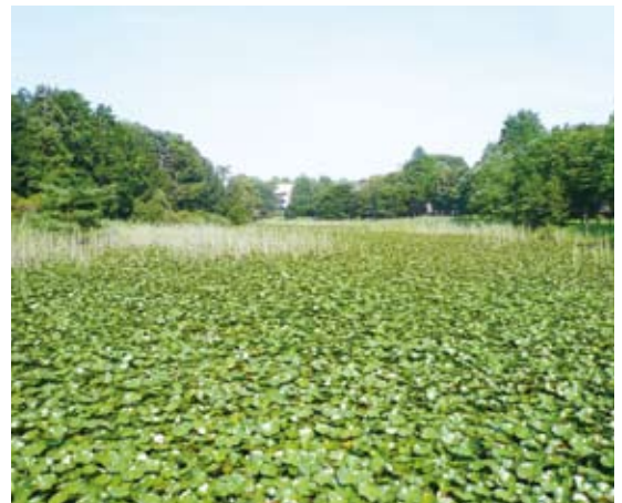
照片9 茨城縣湖泊非常豐富

作成效如下：(1)在荒廢森林的疏伐作業部分，主要以森林公益機能的回復為主，共進行1,326 ha林地疏伐，增加森林吸收二氧化碳能力，預估每年可增加碳吸存量達2,387公噸；(2)在綠色保全及整備的推進方面，主要是針對社區附近的平地林或社區林進行整備工作，除了有助於民眾就近親近森林外，更可以強化森林固碳能力，2009年共整備201 ha林地，預估每年可增加碳吸存量141公噸；(3)在縣產材的活用促進方面，共有380戶申請使用縣產材建築房舍補助，最後只通過補助150戶，此外，有8處公共設施及8所小學的木製品採用縣產材；(4)在森林環境