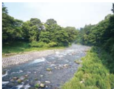
照片6 森林可以調節水量