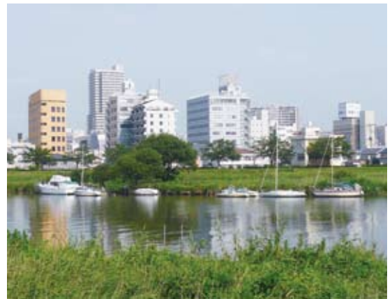
照片10 土浦市濱臨霞浦湖畔