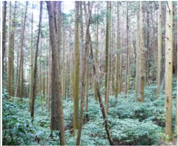
照片2 疏伐後的人工林地被植生多

土壤沖蝕，進而形成溝蝕，最後坡面崩壞坍塌，釀成土砂災害，原有的森林公益功能如涵養水源、調節水量、野生生物棲息等亦不復存在。