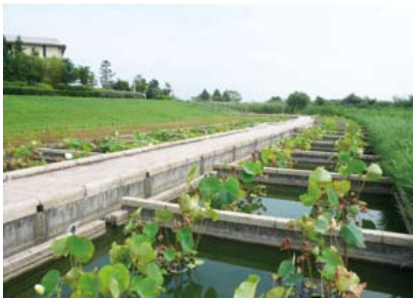
照片14 霞浦湖畔不同荷花品系展示

在森林環境教育方面，縣政府每年補助20個團體，每一件補助案最高可獲得25萬日圓，補助的活動內容區分三大類：(1)森林工作：有利於森林經營工作的推進，包括植樹、除草、打枝、疏伐、除蔓、竹林整備、步道維護、標誌設置等；(2)木材利用：提高縣產材的使用，例如集會所的木料使用、木製玩具、花壇、垃圾桶等木製品的研發；(3)森林環境學習：增進民眾學習機會，包括親子森林教室、森林圖鑑