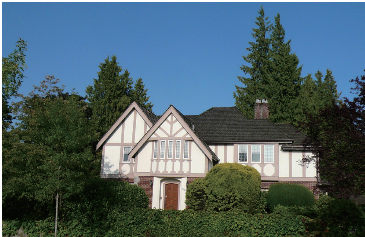
溫哥華的都市林主要位於私有地。

開發造成樹木破壞。另外，樹種選擇也要考慮周遭環境因素，樹根不能危害到基礎設施，樹冠枝幹也要避免破壞房舍或觸及電線，尤其是要留意氣候變遷下氣溫上升、病蟲害遽增或風暴增強時樹種的適應力。