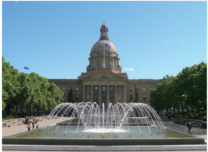
位於艾德蒙頓的省議會被茂密的都市林所環繞。