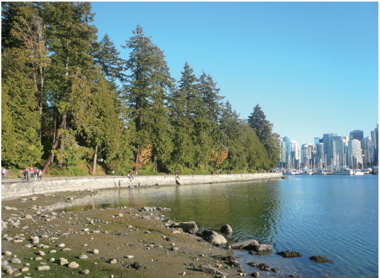
史坦利公園是溫哥華的重要綠地。