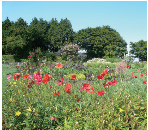
溫哥華有許多公園提供民眾親近自然機會。

方公里，人口63萬，為卑斯省最大城市，全國第九，若將鄰近的市鎮加總起來，則大溫哥華地區的總人口數將高達246萬，位居加拿大第三大都會區（COV, 2017a）。溫哥華市政府的「最綠城市行動計畫」，其中與都市林最密切相關的是親近自然部份，最綠城市行動計畫將讓溫哥華居民享有無與倫比的綠色空間，建置世界上最壯觀的都市森林，具體指標有二：1. 2020年時，確保每個人的住所，在5分鐘步行路程內，能接觸到公園、綠道或其他綠地，並且在2010年到2020年間恢復或增加25公頃的自然地區；2. 從2010年到2020年間，在市區內種植15萬棵樹，到2050年時，將樹冠覆蓋率提高到22%（COV, 2017b）。