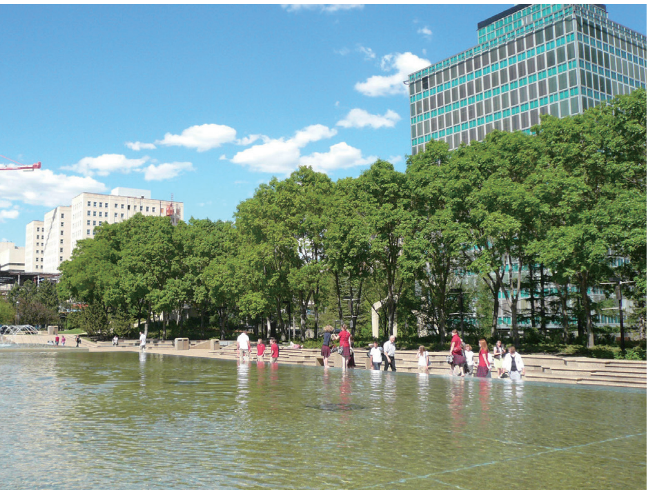
艾德蒙頓都市林具有景觀美化效果。

目標一、8個策略及20個行動方案：提高樹冠覆蓋率至20%，每年進行樹木健康評估，據此推動修枝、移除或汰換樹種等工作；更新植樹標準，包括土壤體積、類型、地點及利用方式等，確保樹木壽命至少50年以上；與權益關係人協調，強化或提高設計開發標準，確保樹木健康；基於資源需求，建立最佳管理標準，並訓練都市林人才；尋求灌溉或水資源回收再利用新技術，供應足夠水源以利樹木正常生長；降低自然災害對都市林之衝擊，研擬樹木風險管理計畫；研發新模式，鼓勵對鄰近區域低衝擊的都市林；研究私有地最佳的都市林管理實務，研發都市林大眾教育教材。