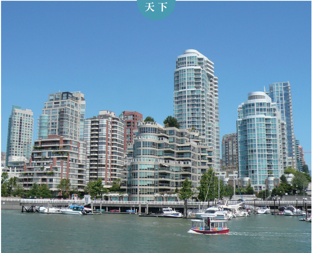
都市林點綴市容增添溫哥華港灣風采。