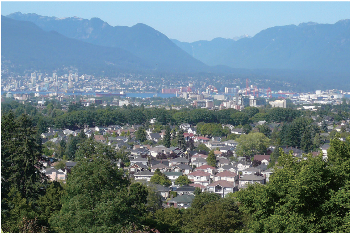
溫哥華都市林是居民重要的生活資產。

溫哥華位於加拿大卑斯省西南方，緊臨太平洋，是加拿大西部最重要的港口之一，也是連貫亞洲與北美的交通樞紐。在布拉德半島上的溫哥華，北臨英吉利海灣及布拉德內灣，南以菲沙河為界，東與本拿比市相鄰，西則隔著喬治亞海峽與溫哥華島相望，全境面積114平