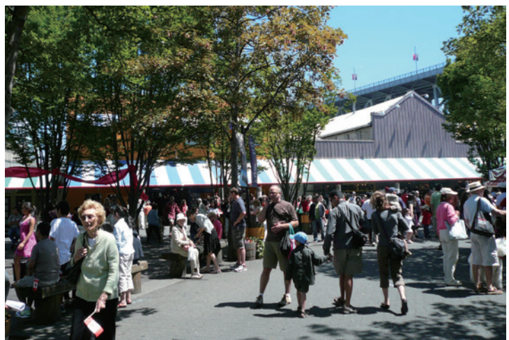
街樹提供遮蔭、休憩及景觀效果。