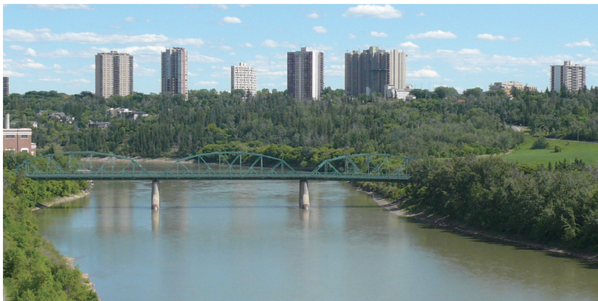
北薩斯喀徹溫河滋潤艾德蒙頓市。