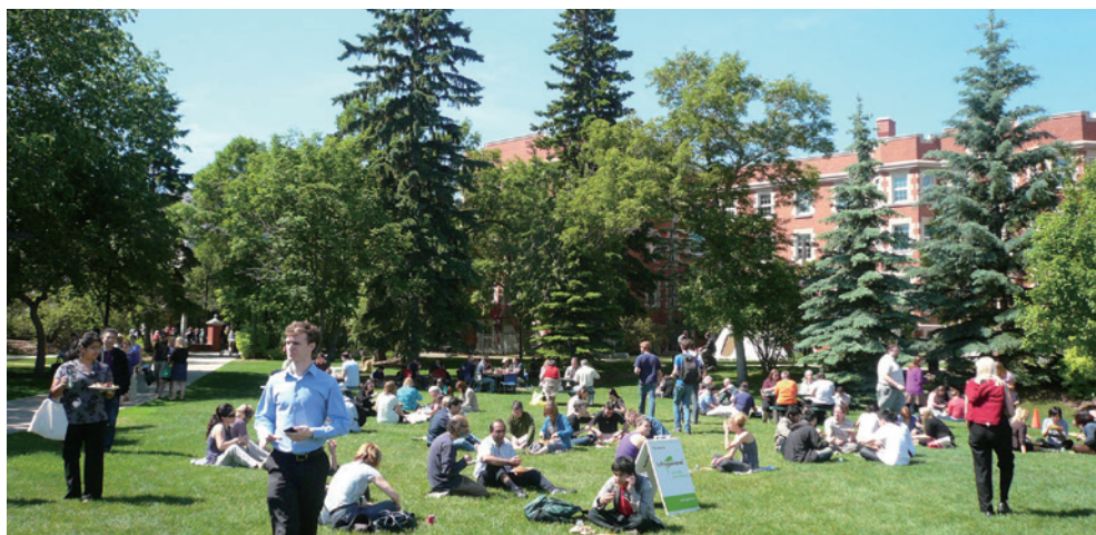
都市林提供艾德蒙頓市民休閒遊憩場所。