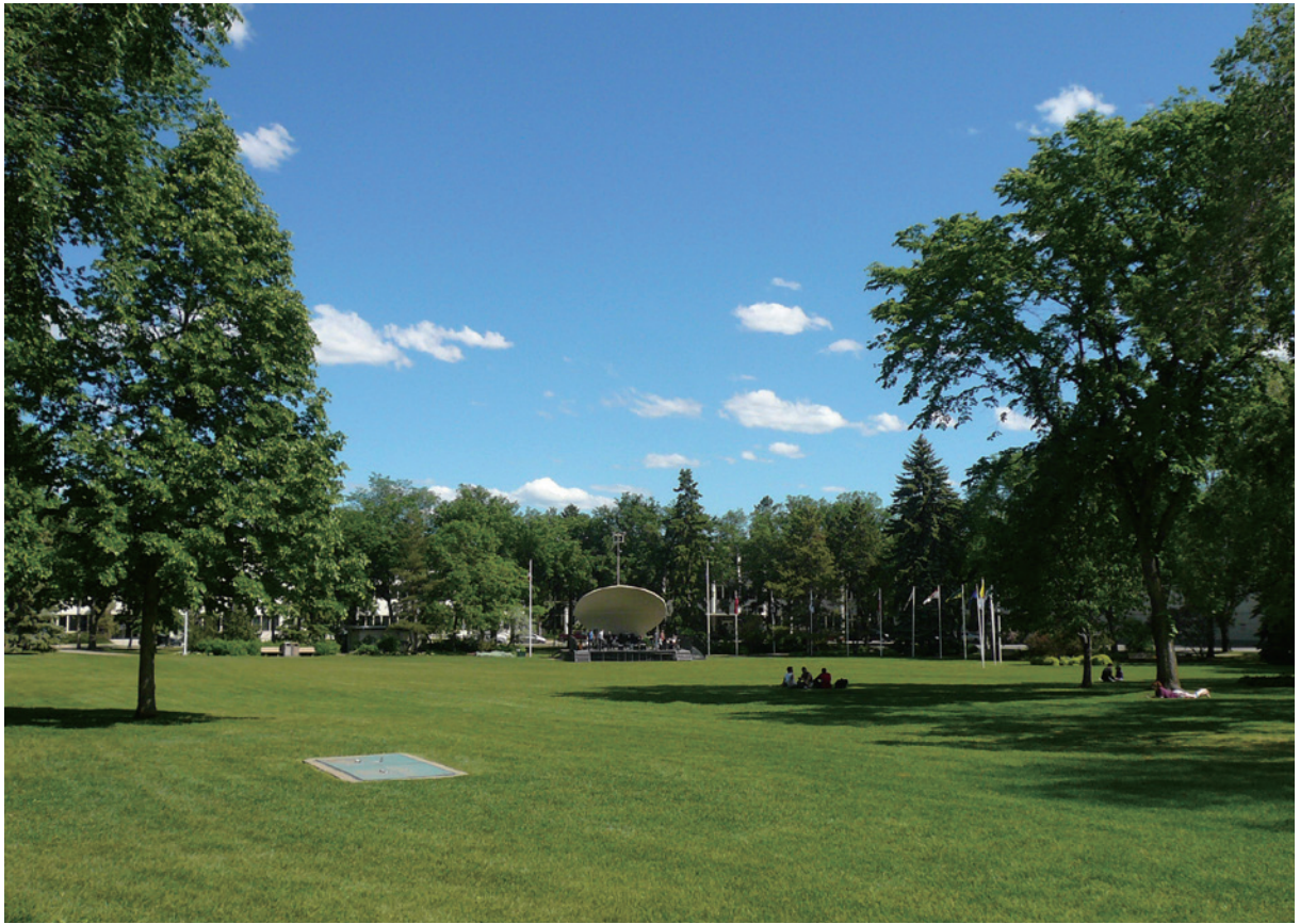
公園綠地提供艾德蒙頓市滯洪防災空間。

目標二、8個策略及10個行動方案：增加私有地森林病蟲害的宣導，監測病蟲害的傳染狀況；增進社會大眾對都市林的認知，知會受到都市林管理所影響的權益關係人；透過網絡傳遞都市林訊息，更新最佳管理實務相關資訊；宣傳都市林、適當維護及節水在生態及健康上之益處，教育課程中增進小學孩童能關心樹木；創造市民及社區參與都市林管理計畫，在現行的保育計畫中加入都市林模組；提升當地街道、公園、學校及自然地區樹木的長期建置及健康，透過教育讓開發商及居民能植樹及照料，經由媒體宣傳工業區及商業區樹木的重要效益；使用手冊、網路及媒體，提高居民認知都市林具有降低環境衝擊之效益，市政府提供員工及廠商都市林教育訓練機會；加強與大專院校的夥伴關係，鼓勵研究及開發都市林知