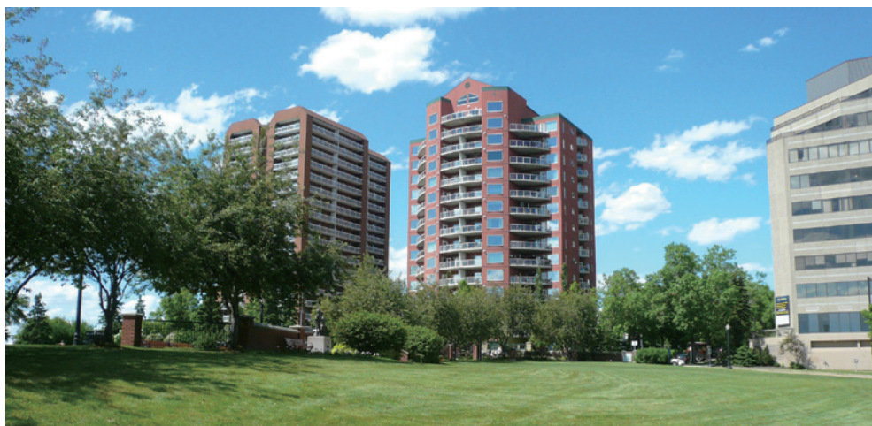
都市林有助於提升艾德蒙頓市居住的優質環境。

艾德蒙頓「都市林管理計畫」是以十年為一期，針對高度大於4.5公尺以上的樹木進行管