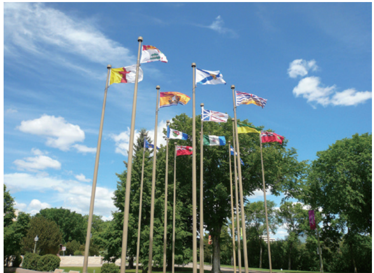
艾德蒙頓市公園內豎立各省及自治區旗幟。