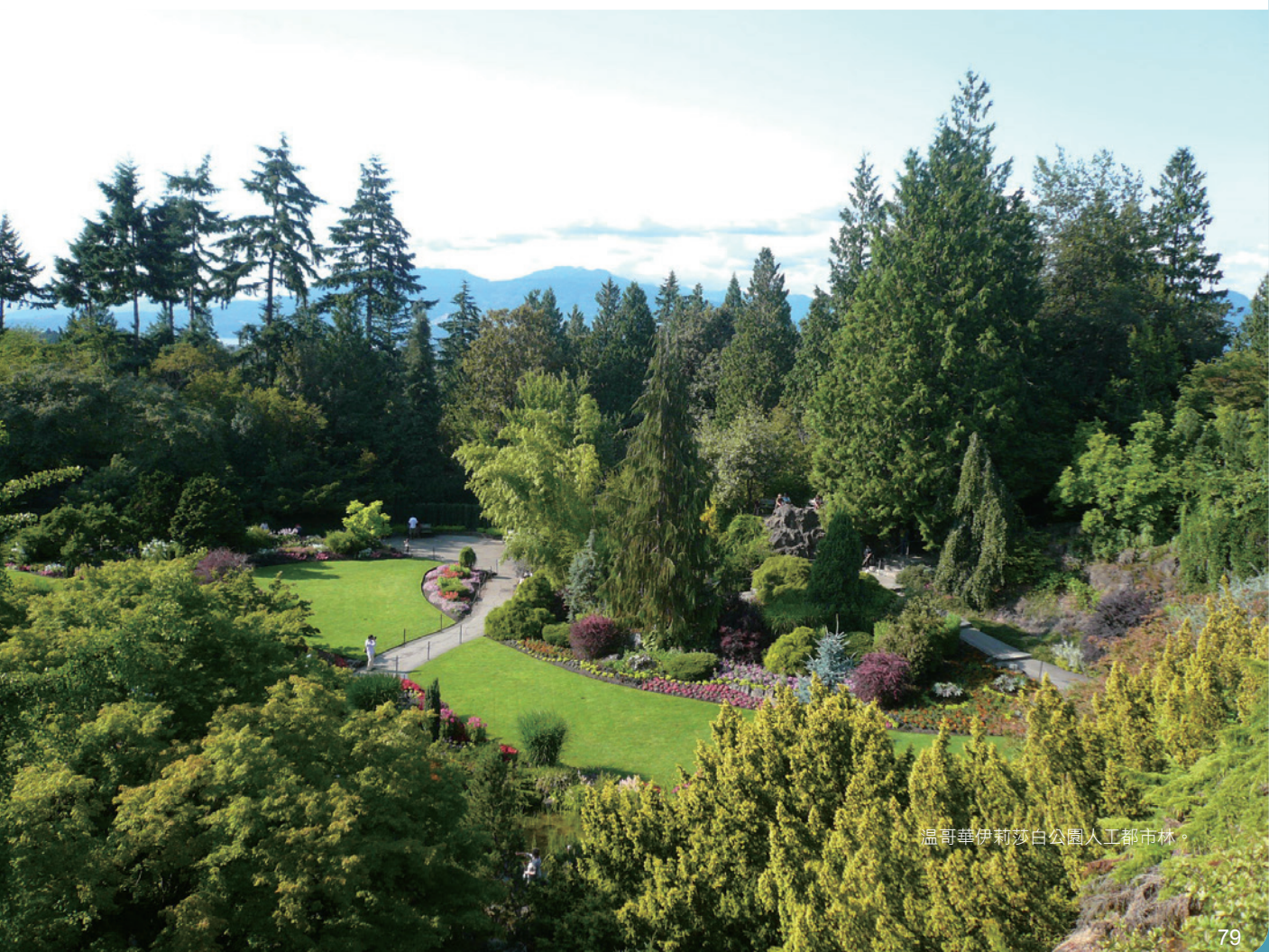
溫哥華伊莉莎白公園人工都市林。

首先，在保護方面，目標是停止樹冠覆蓋率持續降低，基本準則是保護健康成熟的樹木，行動方案有三：1. 修《樹木保護條例》；2. 維持開發基地較多的樹木；3. 創造整體保留的架構。過去居民因為景觀視野、建造房屋、修繕設施、獲取陽光、降低過敏及整治病蟲害等因素，《樹木保護條例》中允許私有地主，每年可以申請在其所有土地內移除一棵胸高直徑大於20公分以上的樹木，此一規定導致近20年