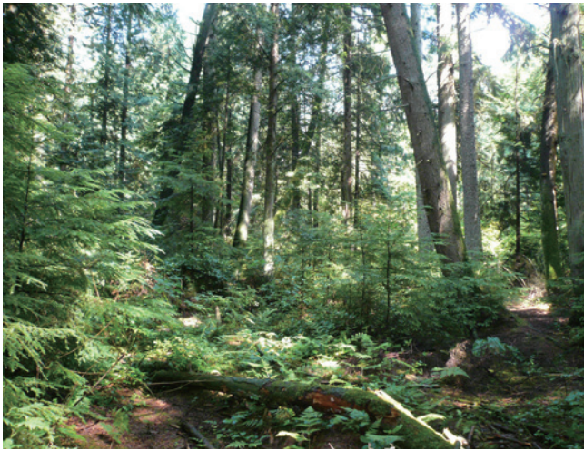
溫哥華太平洋濱海公園天然都市林。