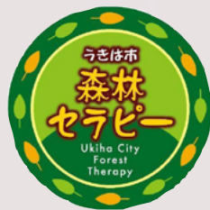
浮羽市森林療癒徽標

在中途休息站時，森林療癒嚮導提供由烏樟、肉桂及甘草等所煉製而成的熱飲，讓學員進行味覺體驗，感受植物的